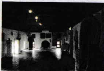
Expoziție de artă populară românească (Ambasada României din Australia)

2. Loc/clădire special amenajat/amenajată pentru expunerea acestor obiecte.